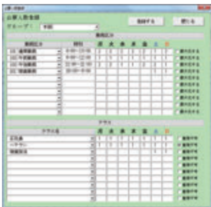
◀必要人数登録画面 ▼詳細設定画面

曜日ごと・勤務区分ごとに必要な人数の登録を行えます。イベントの日等、個別に詳細な設定を行う事も可能です。