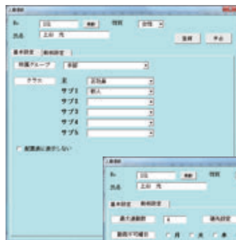
◀人員情報(基本情報)

スタッフごとに「ベテラン」、「新人」等の情報を設定でき、優先したい曜日、希望の勤務区分等、豊富な条件設定が可能です。