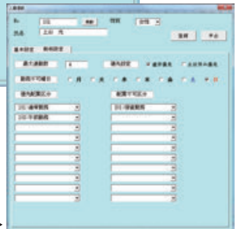
人員配置(勤務設定)▶