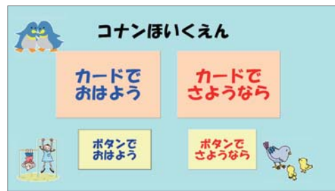
▲分かりやすい大きなボタンだから、迷わず操作できます!

管理画面はエクセルです。園児の登降園の時間のチェックはもちろん、職員の月ごとの出勤時間や残業時間の計算ができるなど出退勤の管理も兼ねています。データは全て管理用パソコンから閲覧や修正、メンテナンスを行います。